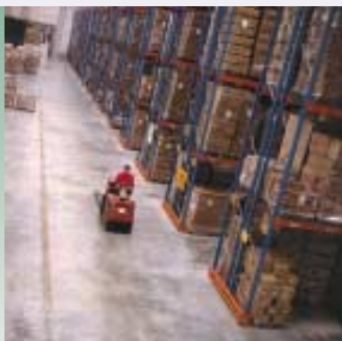
entreprises: ND logistic, R+R