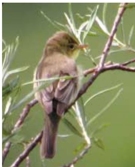
L'Hypolaïs polyglotte

cularité est d'imiter le chant de nombreuses espèces d'oiseaux — a ainsi largement colonisé le site. Quand la haie aura pris plus d'ampleur, il sera remplacé par les autres espèces présentes sur la Plaine de l'Ain, notamment par les rossignols, particulièrement nombreux sur le Parc."