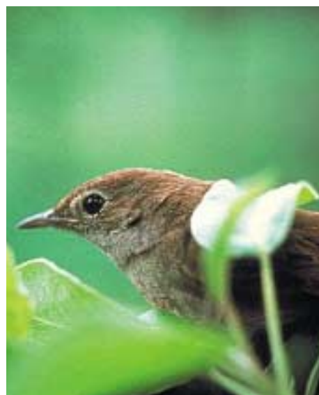
Le rossignol

cularité est d'imiter le chant de nombreuses espèces d'oiseaux — a ainsi largement colonisé le site. Quand la haie aura pris plus d'ampleur, il sera remplacé par les autres espèces présentes sur la Plaine de l'Ain, notamment par les rossignols, particulièrement nombreux sur le Parc."