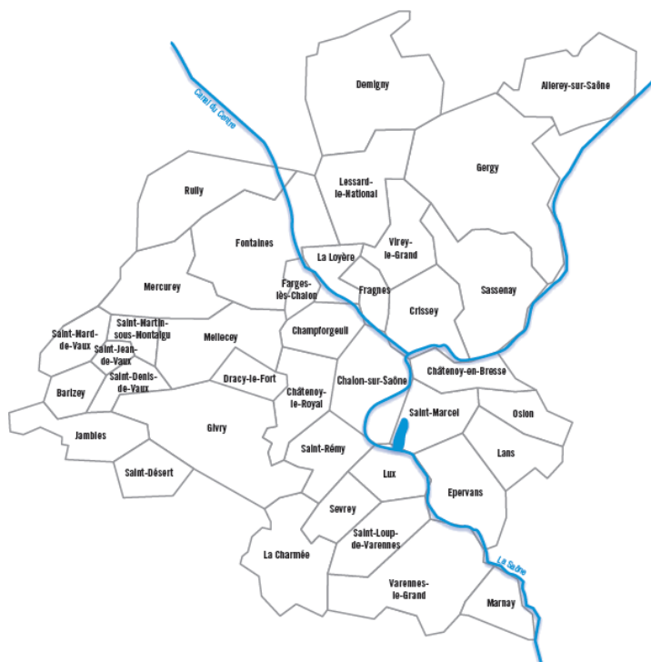
LE GRAND CHALONS, TERRITOIRE ZERO GASPILLAGE ZERO DECHET