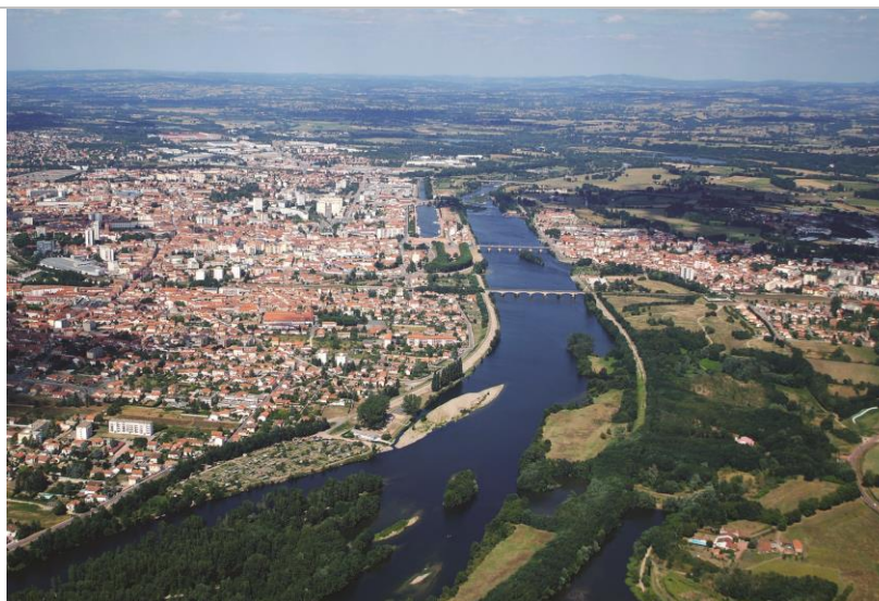
Les 4 vents