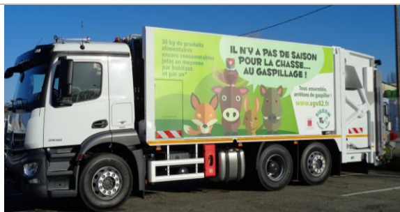
La prévention véhiculée sur tout le territoire.