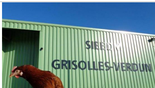
Des poules au SGV pour réduire les déchets.